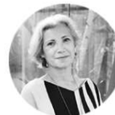
Carme Pinòs Architetto