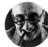
LUIGI CACCIA DOMINIONI