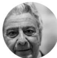
Aldo Colonetti Filosofo