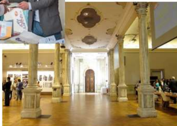
Premiazione "Premio Nazionale" Sala delle Colonne di Ca' Giustinan - VENEZIA